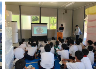
牡蠣の生育について漁業講座

震災で一度はすべてが流されてしまった広田湾 震災から10年経とうとしているいまの海の状況を見学。 自然災害と漁業という視点から 震災後の苦労や、葛藤などリアルなお話を聞きます。