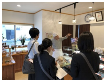
再建された店舗へ訪問