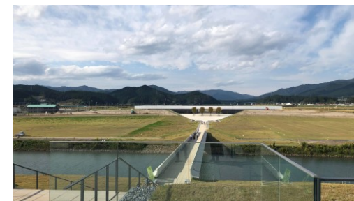
復興記念公園内などをご案内