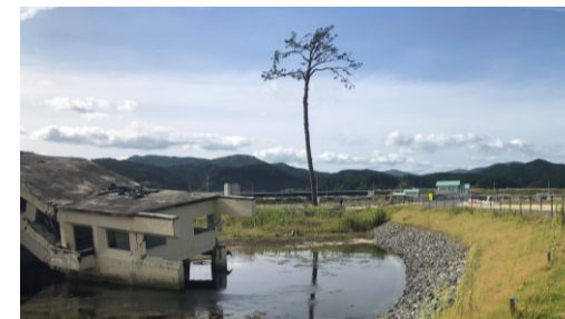
奇跡の一本松周辺