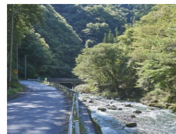
生出川沿いをたどる