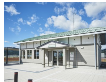
旧駅舎をモチーフにした新駅舎