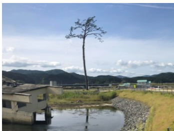
震災遺構「奇跡の一本松」