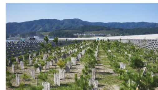
高田松原再生事業