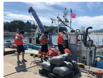
遊漁船で養殖場を見学