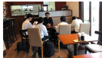
自主研修やヒアリング活動など