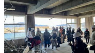
震災遺構への入場見学