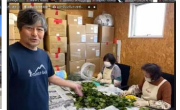
地域産業について