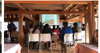
講話・防災クロスロード