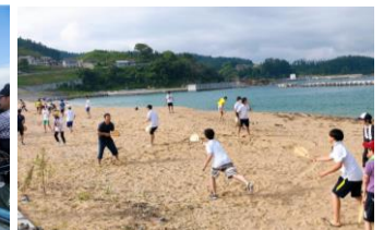
砂浜でのアクティビティ