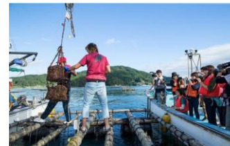
遊漁船・牡蠣養殖いかだ見学