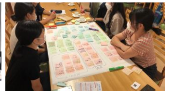
活動にはアウトプット